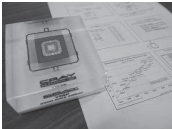
写真2 第二セッション (資料)