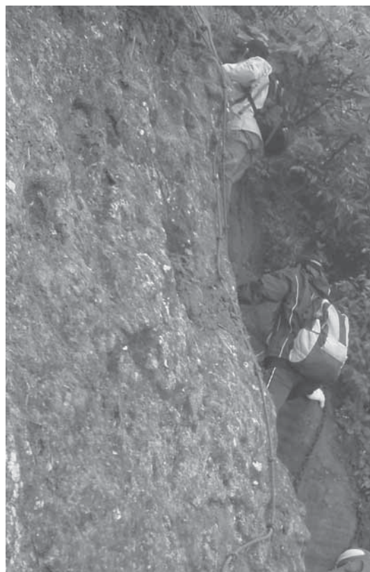
写真 6 林間学校 4