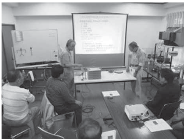
写真1 第一セッション

たくさんのおもちゃやコンピュータの部品、写真・プロジェクタが用意されていたのはとても楽しく、そうした準備を整えてくださった講師や主催者の方々の熱意に感銘を受けた。参加者の多くが気心の知れている間柄で、リラックスした雰囲気の中に日程が進行して行き、その中では例外的に日比谷高校関係者以外の参加者である我々も楽しい時間を過ごすことができた。