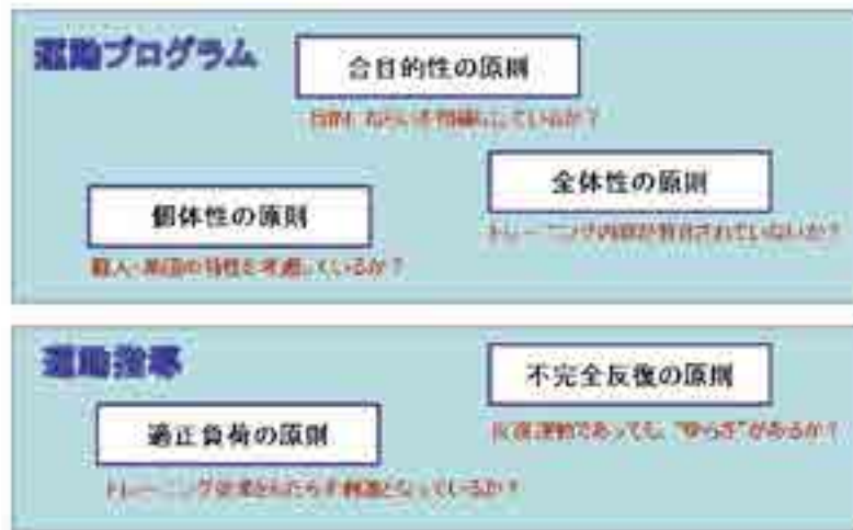
図3 コーディネーショントレーニングの5つの原則（荒木、2014）