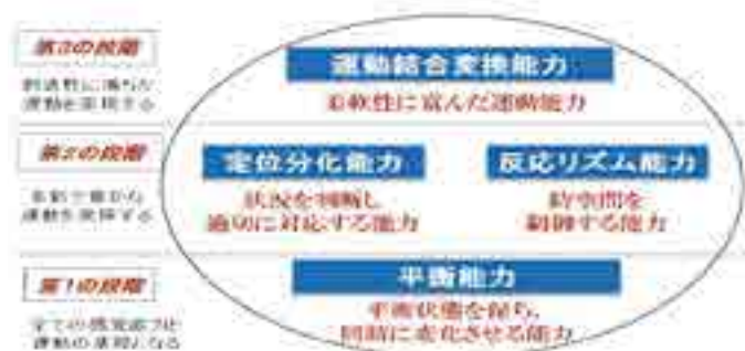
図2 運動実践で捉えるコーディネーション能力の構造（荒木、2014）

これらのことから、現在の子供の体力における本質的で根源的な課題は、コーディネーション能力の低さにあると考える。本質的で根源的な課題がコーディネーション能力であるならば、その課題を解決するためのトレーニングがコーディネーショントレーニングということになる。