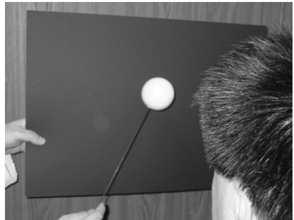
図2 STYCAR法による視力検査場面

検査は、まず最大のボールを対象者の眼前38cmに呈示し注視するか確認した。その後、ボール左右に動かして追視が見られるかどうかの確認を行った(図2)。一つのボールに対して3試行を限度とし、注視、追視が確認された時点で次の大きさのボールへ移行した。なお、最小のボールで追視力が確認された場合は、視距離を38cmから延長し追視できる最長の距離を確認した。視力の換算法はPL法と同様である。