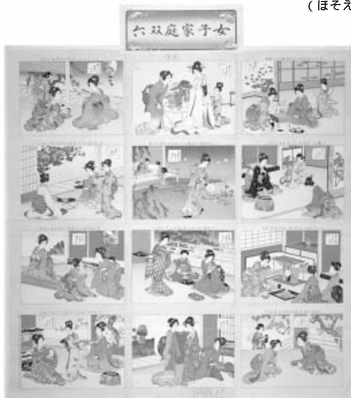
女子家庭双六 牧金之助刊 明治31(1878)年