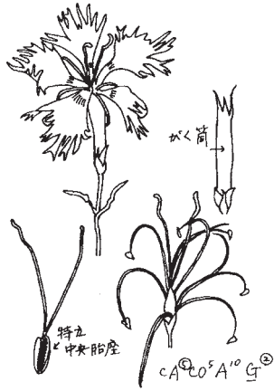
ナデシコ (園芸品種). 2002.6.20. 東京都府中市