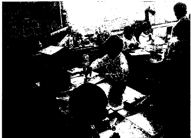
〈まずは、滑るところを作ろう。折り目をつけて……〉