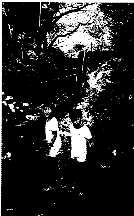
〈流しっこ競争するよ!〉