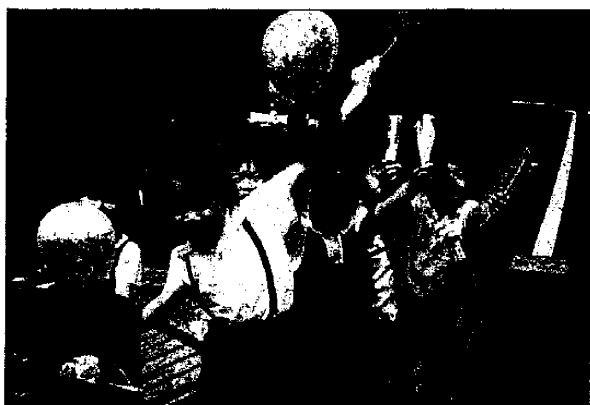
〈郵便局やコンビニで、いいものもらったよ!〉

次に子どもたちが出かけたのは、「教育の森公園」であった。虫探し、遊具での遊びなどの他、じゃぶじゃぶ池での男女対抗水かけ戦争にも発展した。「文京シビックセンター」にも出かけた子どもたちは、25階の展望台から竹早小学校や自分の家を探したり、エレベーターの速さに驚いたり、5階のコンピューターで遊んだり、警備員の方にインタビューしたりした。そして「また、じゃぶじゃぶ池で遊んでみたい。」という願いが強く出され